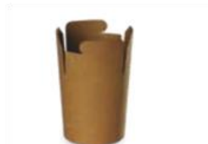
2 POT PATES KRAFT BRUN 480