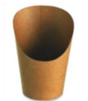
POT WRAP BRUN 5,5