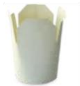
1 POT A PATES 780